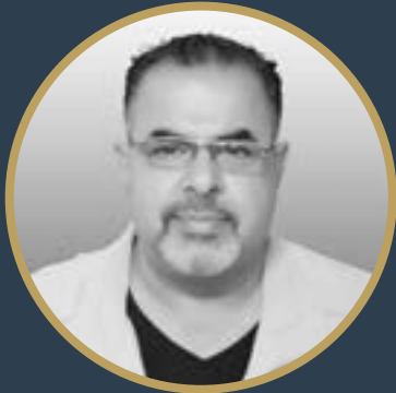
بقلم عمر شريقي

الداء بالطبع ليس في العمالقة بقدر ما يكمن في عدم الاستفادة من وجود هؤلاء والاقتداء بهم ودراسة منهجهم ونظرتهم بدلا من انتهاج أسلوب الانفرادية ، والانفرادية تأتي من منطلق أن كل صحفي يحاول أن يكون له أسلوبه المميز وكلماته التي تشير إليه وهذا في حد ذاته ليس عيبا بل العيب أن يكون هذا الأسلوب مفتعلا ومصطنعا حتى إذا ما قرأه أحد لا يجني من ورائه سوى ضياع الوقت ومن هنا اختلفت الجهات وتعددت الأقلام المسؤولة ،