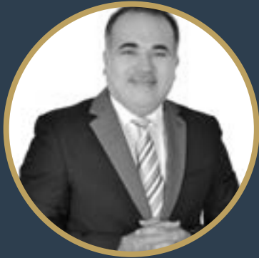
بقلم د. أحمد طقش

و لعل هذا التوازن بين السياسة و التجارة هو سر أسرار الإمارات الذي جعلها منارات هاديات على طريق الخير و البشارات