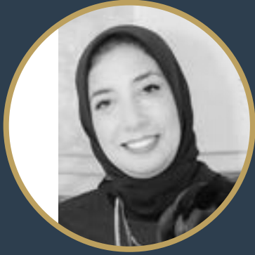
بقلم برديس رزق

ولذلك ننصح بالقيام بالانشطه والخروج عن العادات اليوميه بفعل انشطه مختلفه ومحفزه وابتسم فالابتسامه سر الحياه .