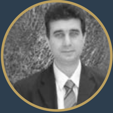
بقلم هاني محمد علي

فهل تفعلها مستغلة عاملي الأرض و الجمهور لتحقيق اللقب الحادي عشر ام تذهب البطولة لمنتخب خليجي اخر .