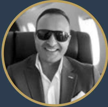
بقلم د. كريم مراد

الوصف: تحليل المعاملات والعقود لاكتشاف أي تضارب مصالح محتمل التطبيق الفعلي: أنظمة مثل AI Contract Analysis تُستخدم لفحص العقود بحثاً عن تضارب المصالح. الفائدة: ضمان الشفافية وحماية مصالح المساهمين.