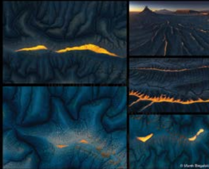
ماريك بيغالسكي - بولندا MAREK BIEGALSKI - POLAND

القوة - الدورة الرابعة عشر 2025 POWER - FOURTEENTH SEASON 2025