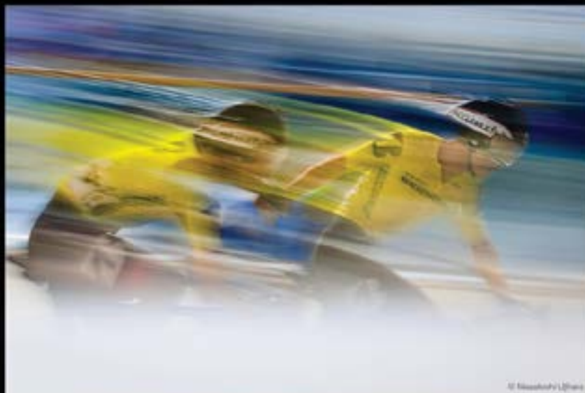
ماساتوشي أوجيهارا - اليابان MASATOSHI UJIHARA - JAPAN

القوة - الدورة الرابعة عشر 2025 POWER - FOURTEENTH SEASON 2025