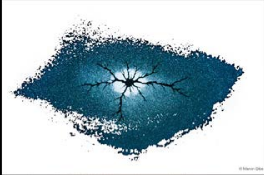
مارشين جيبا - بولندا MARCIN GIBA - POLAND

القوة - الدورة الرابعة عشر 2025 POWER - FOURTEENTH SEASON 2025