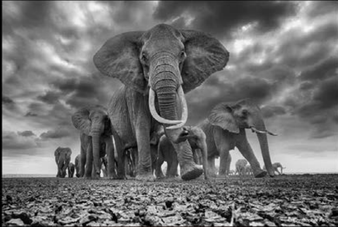
كريس فالوز - جنوب أفريقيا CHRIS FALLOWS - SOUTH AFRICA

القوة - الدورة الرابعة عشر 2025 POWER - FOURTEENTH SEASON 2025