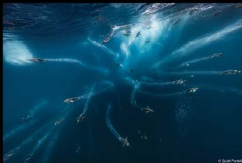
سكوت بورتيلي - أستراليا SCOTT PORTELLI - AUSTRALIA

القوة - الدورة الرابعة عشر 2025 POWER - FOURTEENTH SEASON 2025