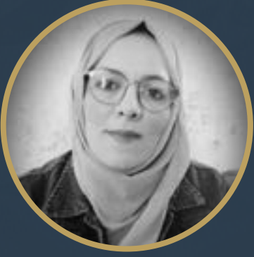
بقلم د. رجاء صالح الجبوري

مدّت عاملةً المتجر عنقها نحوي أكثر من مرّة، حين طال وقوفي أمام فاترينة الحقائب في الجناح المخصّص للأحذية والحقائب في المجمع التجاري الأضخم في المدينة. لم أكن أقف أمام الحقائب بقدر ما كنت أقف أمام حيرتي. لم أبحث عن حقيقة بقدر ما كنت أبحث عن تفسير.