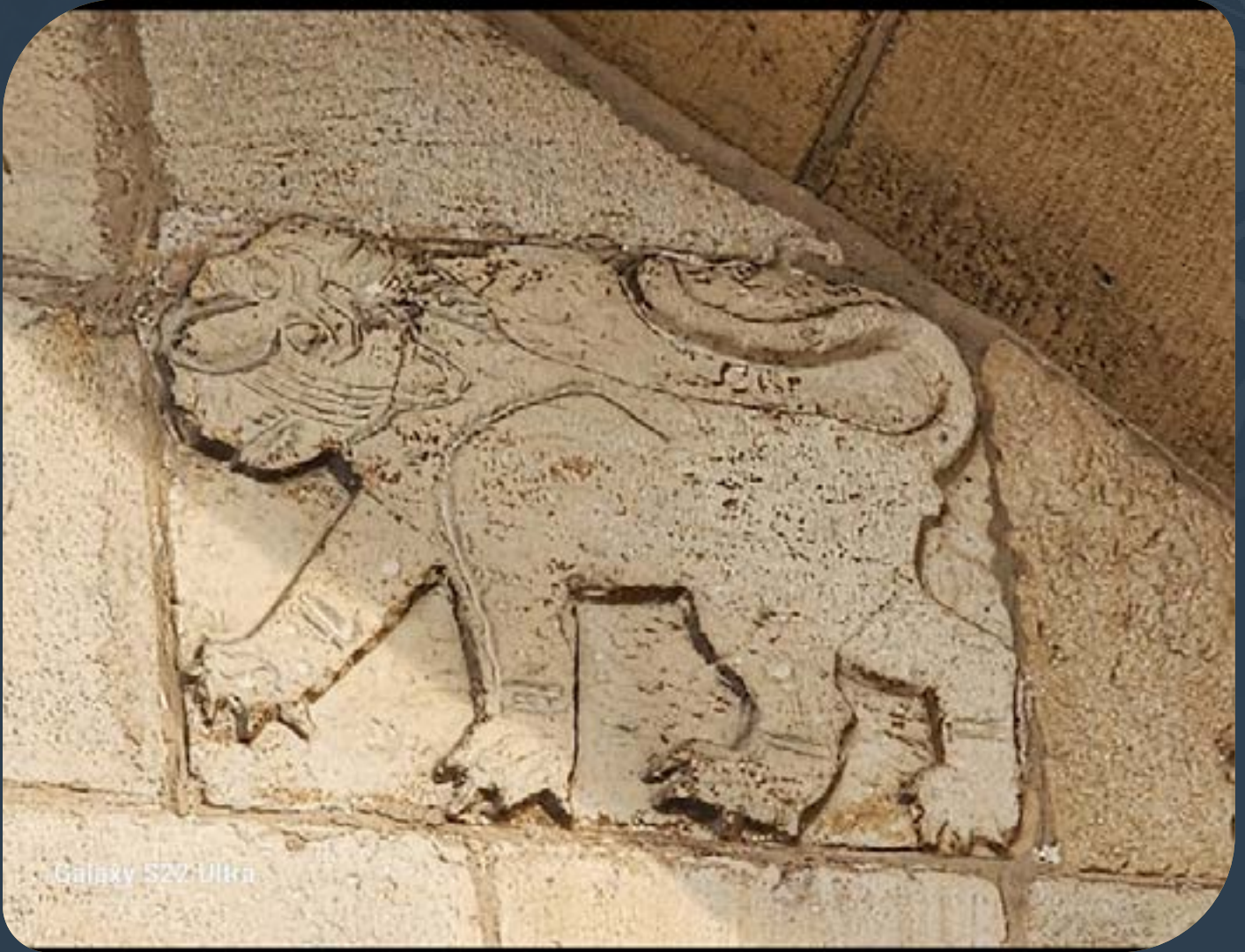
Galaxy 522: Ulka

يعود تاريخ هذه القلعة إلى عام ١٣٨٧، أي عام ٧٨٩هـ، حيث بناها الأمير يونس بن عبد الله النورزي بناءً على طلب من السلطان برقوق أحد سلاطين العصر العربي الإسلامي المملوكي ومؤسس دولة المماليك البرجية. ما يدل على ذلك هو نقش عربي بارز في القلعة يذكر أن البناء شيد بين عامي ١٣٨٧-١٣٨٨م، على يد يونس النورزي الذي كان موظفًا في دولة المماليك البرجية تحت حكم السلطان برقوق. وقد بنيت لتكون بمثابة مركزاً يتوسط الطريق بين دمشق والقاهرة، يتخذة التجار والمسافرين مكاناً للراحة واللقاء والتزود بما يلزمهم من حاجيات في تلك الرحلة الطويلة بين أكبر مدينتين