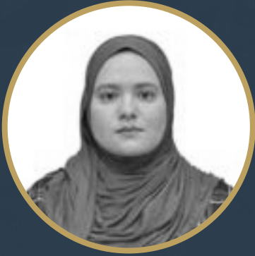
بقلم مسعودة فرجاني

إن التراث الثقافي، بجميع أبعاده المادية وغير المادية، هو العمود الفقري للهوية الوطنية والذاكرة الحية التي تُشكل وعي الأمة ورؤيتها للعالم. إنه ليس مجرد سجل للماضي، بل هو تاريخ مستمد ومتجدد باستمرار، يتدفق في شرايين الحاضر ويُثير دروب المستقبل. في عصر الكونية المتسارع، الذي يهدد بطمس الخصوصيات الثقافية لصالح نمط استهلاكي موحد، يصبح فهم القيمة الجوهرية للتراث، والدفاع عنه وصونه، أولوية قصوى لضمان استمرار الوجود الحضاري للشعوب.