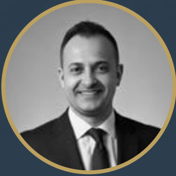
بقلم د. كريم مراد خبير تقني ومعلوماتي

في أحد أحياء القاهرة الراقية، يستخدم طفل في العاشرة من عمره تطبيقات الذكاء الاصطناعي لإنجاز واجباته المدرسية وتعلم لغات جديدة. وفي الوقت نفسه، على بعد مئات الكيلومترات في قرية نائية، يكافح أقرانه للحصول على اتصال مستقر بالإنترنت. هذا المشهد يلخص واقع الفجوة الرقمية في عالمنا العربي، والسؤال الأهم: هل ستزيد تقنيات الذكاء الاصطناعي من هذه الفجوة أم ستساهم في ردمها؟