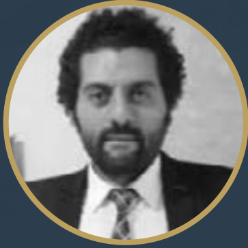
بقلم د/ محمد كامل الباز