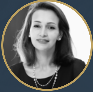
بقلم نورا البُديري

هنياً لأي فريق سيربح البطولة لأننا على قلب رجل واحد بإذن الله.