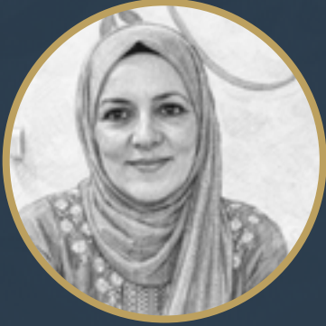
بقلم د. رجاء صالح الجبوري

كانت أنا تُحکم إغلاق الزجاجة التي تحبس الخنفساء المضيئة، حين نظرت حولها فجأة.