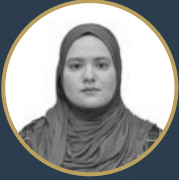
بقلم مسعودة فرجاني